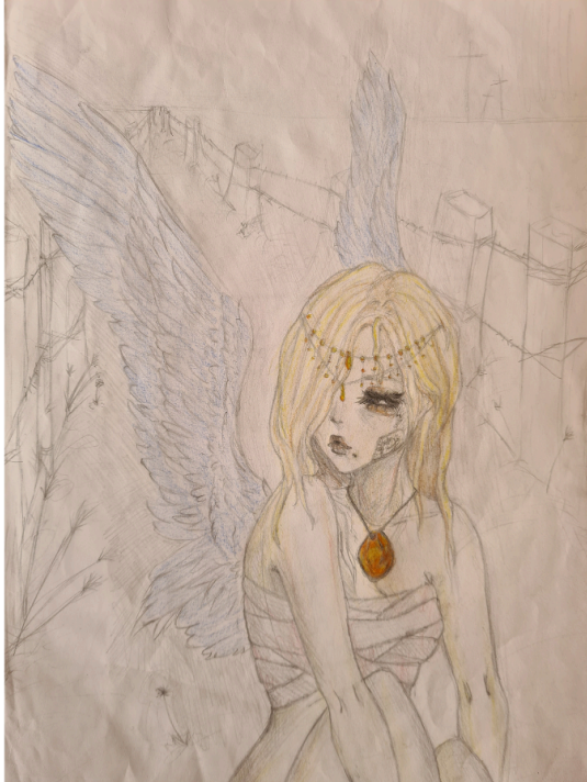
Luiza Yeromenko, 10 klasė