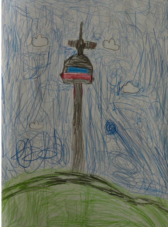
Kristupas Smolskas, 1 klasė