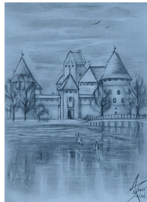
Adel Orel, 8 klasė