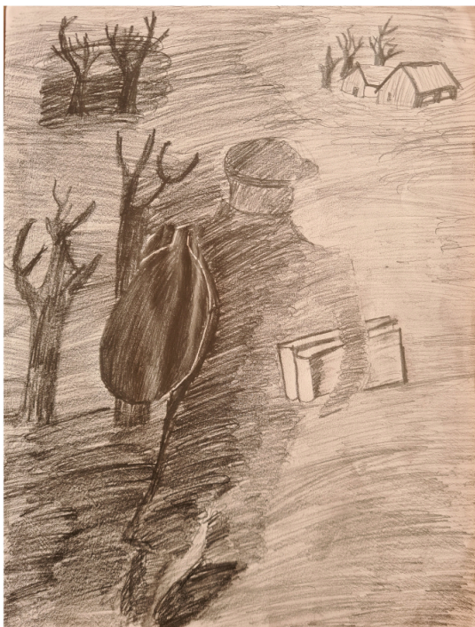
Domas Skurkevičius, 9 klasė