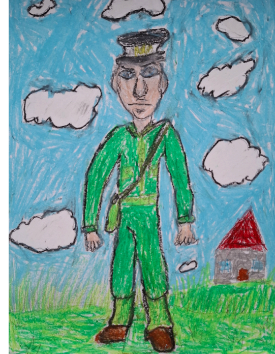
Simas Sadauskas, 7 klasė

Gabija Blauzdžiūnaitė ir Paulina Pilkaitė „BULVĖ: kaip ši daržovė pakeitė lietuvių valgymo įpročius“.